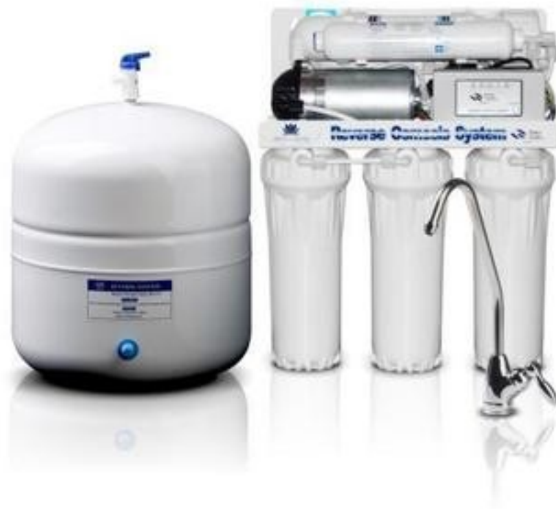
Vieastmeline veepuhastussüsteem pöördosmoosi baasil

Pöördosmoos on tänapäevane joogivee puhastamise meetod, kus vesi läbib pärast mitmeastmelist eelfiltreerimist spetsiaalse membraani, mis eraldab veest suurema osa (kuni 99,8%) seal lahustunud mineraalidest ja sooladest. Membraani läbimatu mineraalidest ja sooladest küllastunud vesi juhitakse kanalisatsiooni. Seadmed töötavad ilma kemikaalideta ja eraldavad veest ebameeldiva lõhna ning maitse, bakterid, lahustunud soolad ja kahjulikud raskemetallid.